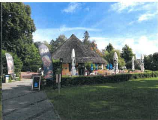
Kiosk, Ansicht von Süden